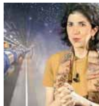
Il fisico italiano Fabiola Gianotti