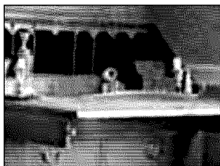
La scrivania di Charles Dickens nella casa museo di Portsmouth, dove lo scrittore è nato. In alto, Charles Dickens