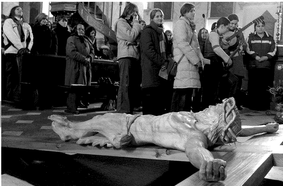
A destra, una liturgia durante il Venerdì Santo in una chiesa polacca. In basso, un senzatetto. Nel Messaggio per la Quaresima 2012 il Papa invita a farsi carico degli altri per camminare insieme verso la santità