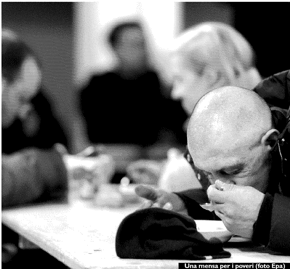
Una mensa per i poveri